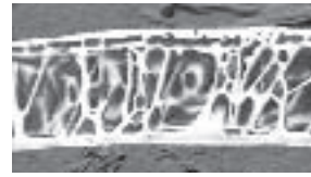
Wewnętrzna budowa kości ptaka