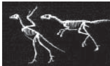
Uderzające podobieństwo: archaeopteryx i compsognatus