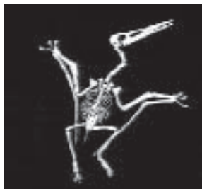
Pterozaur z gatunku pteranodon