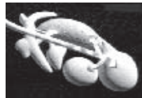
Worki powietrzne – napelnianie tlenem