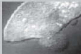
Rozrywana komórka orzęska

Brak zasolenia jest fatalny w skutkach dla zwierząt morskich, ponieważ mniejsze stężenie soli mineralnych niszczy komórki, podstawę życia. We wnętrzu komórek zawarty jest mikroskopijny "ocean" , z całym bogactwem białek i soli mineralnych. Taka komórka zanurzona w wodzie morskiej znajduje się w stanie równowagi, lecz w wodzie rzecznej,